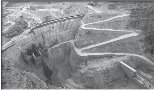
مشاور وزیر نیرو: