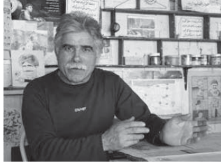
دن گولانه افراد است.