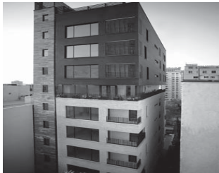
مدیریت حاج جواد صادقی