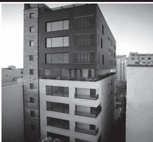
مدیریت حاج جواد صادقی