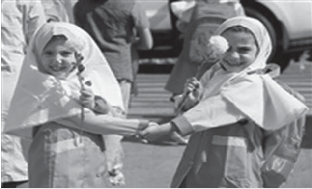
باز آمد بوی ماه مدرسه بوی بازی های راه مدرسه

خطر بیماری های قلبی عروقی را جدی بگیرید به مناسبت ۷ مهر ماه، روز جهانی قلب