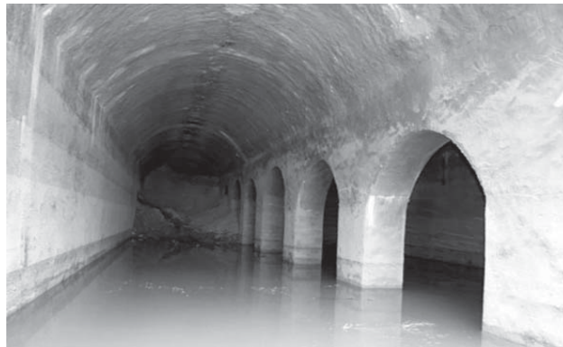
«قنات قصبه یا کاریز گناباد، کهن‌ترین و عمیق‌ترین قنات جهان است که تاریخ ساخت آن به بیش از ۲۵۰۰ سال پیش و دوره هخامنشیان بازمی‌گردد»

قنات بلده فردوس *** «قنات بلده فردوس» قناتی در شهر تاریخی فردوس در مشهد است و می‌گویند