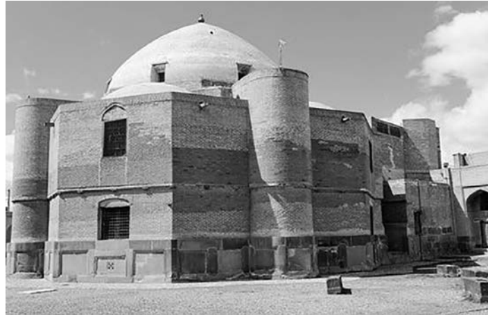
محل دفن شیخ‌صفی

کتاب تاریخ عباسی می‌گوید در مجموع هزار و ۲۲۱ قطعه چینی اهدایی شاه عباس با مهر او در این تالار نگهداری می‌شد، حالا اما تمام آن طبقه‌های طراحی شده در مقرنس‌های گچی ایوان‌ها خالیست. می‌گویند بخشی از این چینی‌ها را روس‌ها به غارت برده‌اند و در موزه‌های روسیه نگهداری می‌شود، تعداد دیگری طرف چینی قدیمی البته هنوز در این تالار هست، در مکعب‌های شیشه‌ای با برچسب‌هایی که تاریخ