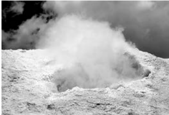
تفتان کوهی با ارتفاع ۴۰۵۰ متر