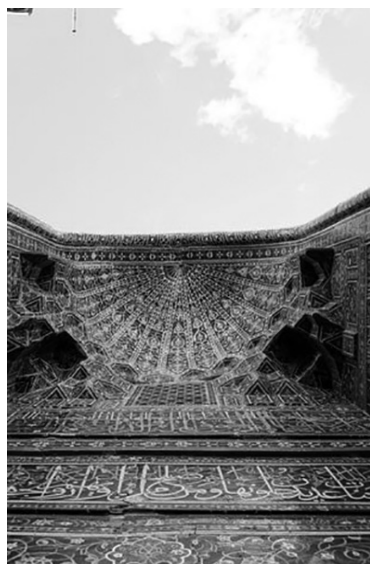
یکی از طاقهای مقبره

به نظر می‌رسد بقعه شیخ صفی هنوز آن قدرها آماده جذب گسترده گردشگران خارجی نیست، ارزانی بلیت ورودی یکی از دلایلی است که دیدار این مقبره را برای همه از جمله بچه‌های قد و نیم‌قدی که نمی‌توانند ارتباطی با فضا برقرار کنند راحت کرده است، هنوز خبری از هدفون‌هایی که بشود با آن توضیحات در مورد بنا را به هر زبانی شنید نیست، اغلب راهنماهای بنا به هیچ زبان خارجی مسلط نیستند و این مشکل دیگری برای گردشگرهای خارجی است. می‌گویند قرار است به زودی کدهای قابل شناسایی برای تلفن‌های هوشمند در محل بگذارند تا دیگر نیازی به تلاش راهنماها برای گروه‌کردن مردم و ارائه توضیح با صدای هر چه بلندتر نباشد، منتها این تغییرات نیازمند اعتبار است و باید منتظر بود.