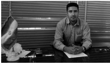
سال دفاع مقدس برگزار خواهد شد.