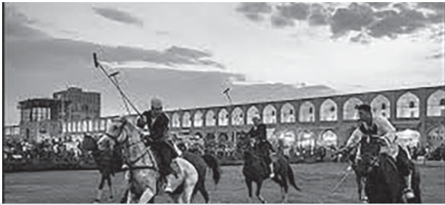
معاون میراث فرهنگی: پرونده ثبت جهانی چوگان به یونسکو ارسال شد

شیوه اصلاح زندگی در مطب پزشکان اتفاق نمی افتد