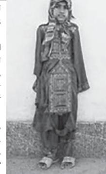
همپای این روزهای رقیه، همین دمیایی‌های پاره و کهنه است

«من می‌خواهم صحنه‌هایی را به تو نشان دهم که مثل سیلی به صورتت بخورد و امنیت تو را خدشه‌دار کند و به خطر بیندازد. می‌توانی نگاه نکنی، می‌توانی خاموش کنی، می‌توانی هویت خود را پنهان کنی، مثل قاتل‌ها، اما نمی‌توانی جلوی حقیقت را بگیری، هیچ‌کس نمی‌تواند...» تصویر زیر، جلوه آشکاری از این جملات کاوه گلستان عکاس مشهور است. «قیه» ۷ سال دارد. کلاس اول است. پدرش «غریبک» از نخل افتاده و چند سالی می‌شود که از کار افتاده است. تمام زندگی‌شان در کبری می‌گذرد رها شده در کنجی از یک روستای خشک و فراموش‌شده.