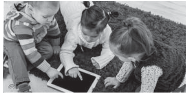
خصوصی والدین را نیز به خطر بیندازند.

مراقب تصاویر و مطالبی که کودکان در شبکه های اجتماعی ارسال می کنند باشید. در یک فضای مجازی ایده آل، کودکان هیچ تصویری از خود یا دوستانشان را بدون آگاهی والدین منتشر نمی کنند؛ اما در واقعیت این گونه نیست. کودکان ممکن است خواسته یا ناخواسته اقدام به انتشار محتوا و تصاویر در شبکه های اجتماعی و فضای مجازی کنند؛ تصویری که ممکن است حریم خصوصی وی و حتی حریم