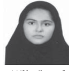
نگین صداقت ۱۸/۴۹